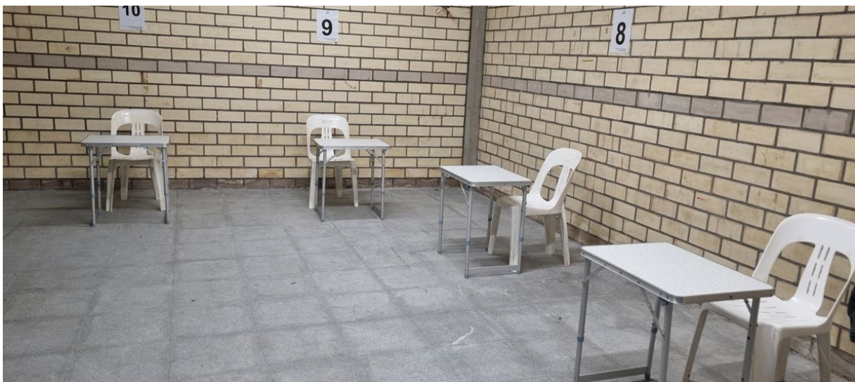
Bord 7-14 stående klasser