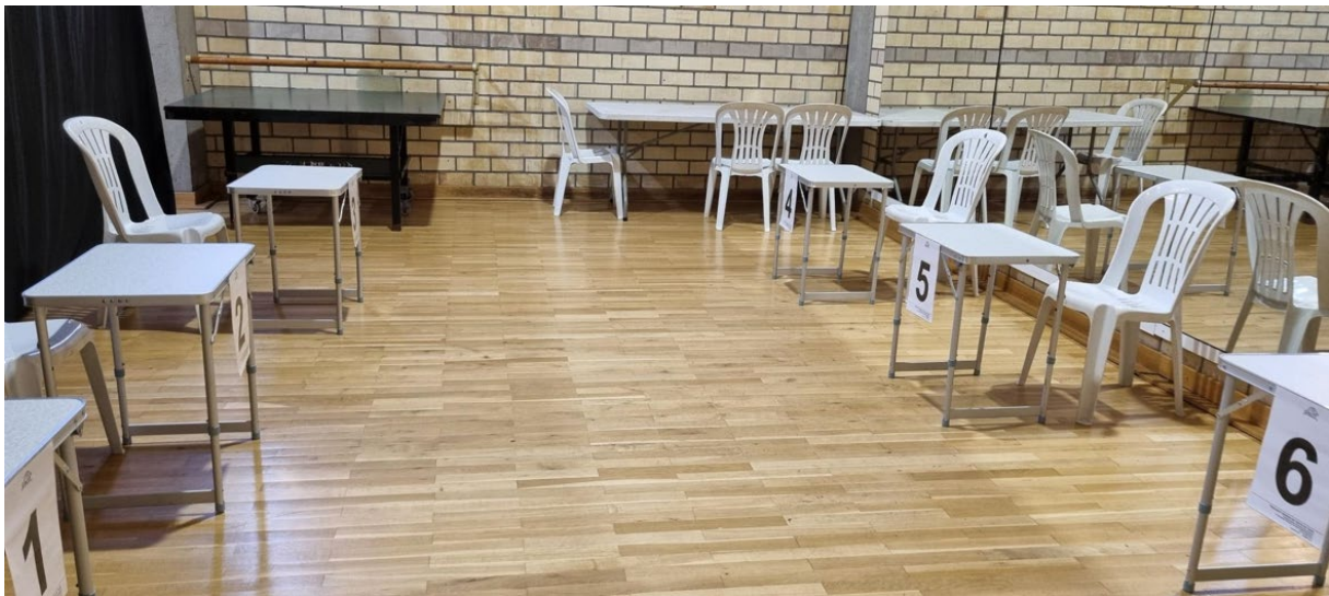
Bord 1-6 rullstolsklasser

Samling i call area inför varje match/reservpass 25 min före matchstart. 20 min före start förväntades spelarna vara på plats för kontroll av racket, klädsel och bollval. Call area var uppdelad för ståendeklasser och en Call Area för rullstolsklasser. Detta var bra och gjorde ytorna tillräckligt stora och bra fokus på de olika behoven och kraven på kontroller tex gällande rullstolar.