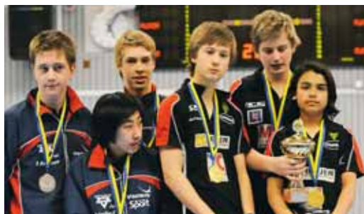
P15: Lyckeby pallade – klubbens tredje guld.