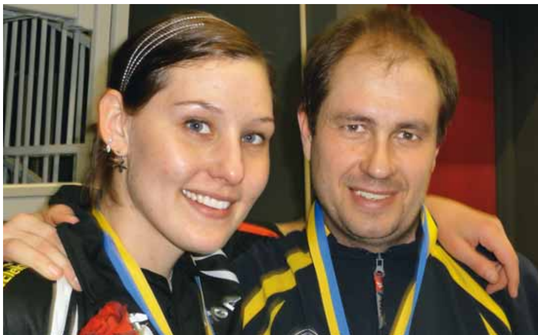
NYGAMMALT MIXEDPAR som spelade lika bra som förr.

– Vi diskuterar ihop oss om en grundtaktik som vi justerar på vägen beroende på vilka vi möter. Vi är båda taktiskt lagda – det gav resultat.