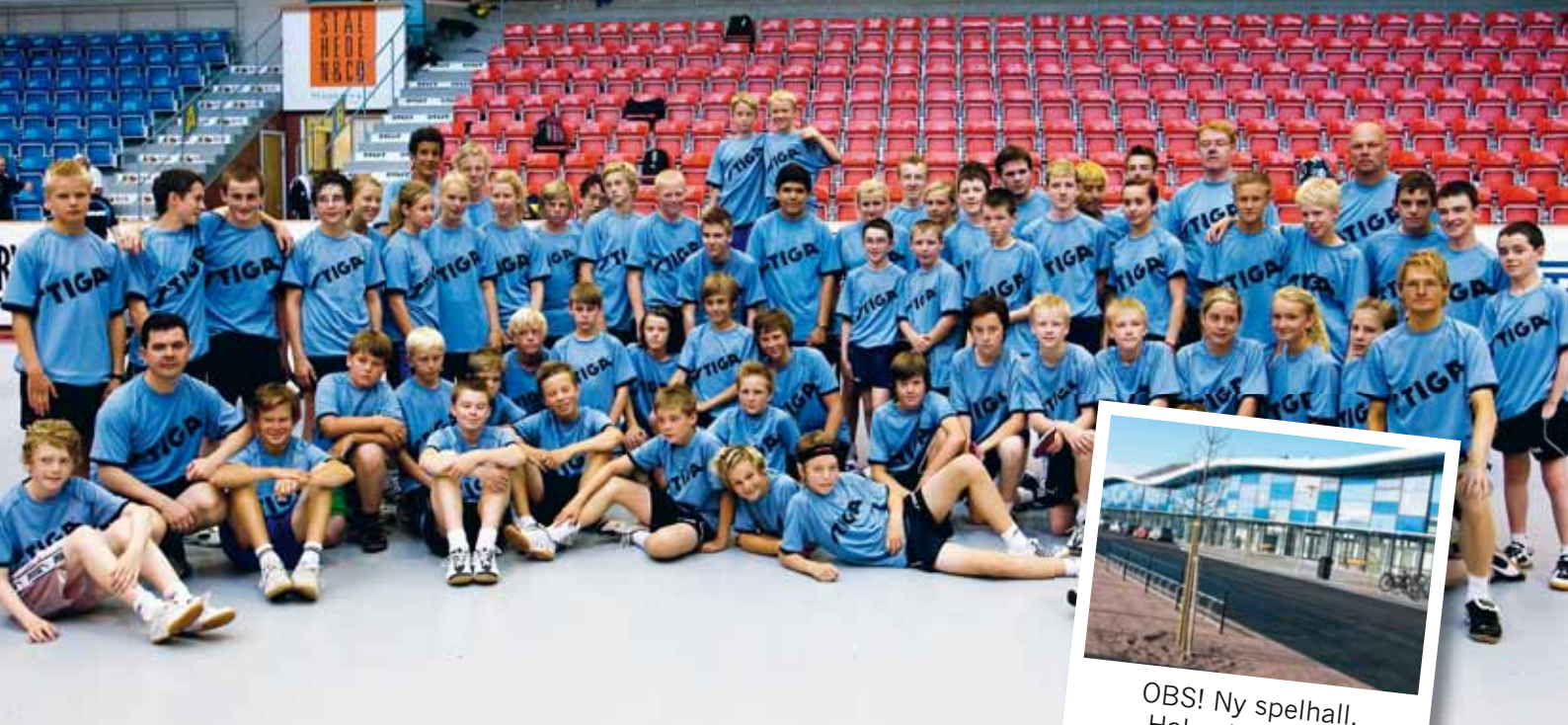
OBS! Ny spelhall, Halmstad Arena