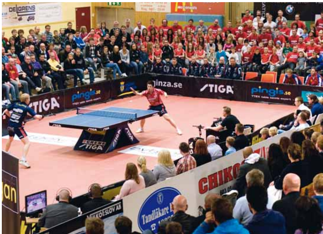
EN LADDAD FINAL med fin inramning. Efter fem raka guld för Eslövs AI var det Söderhamns UIF:s tur att slå till.