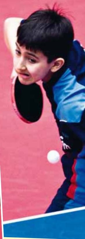
SERVEN BET, Omid.