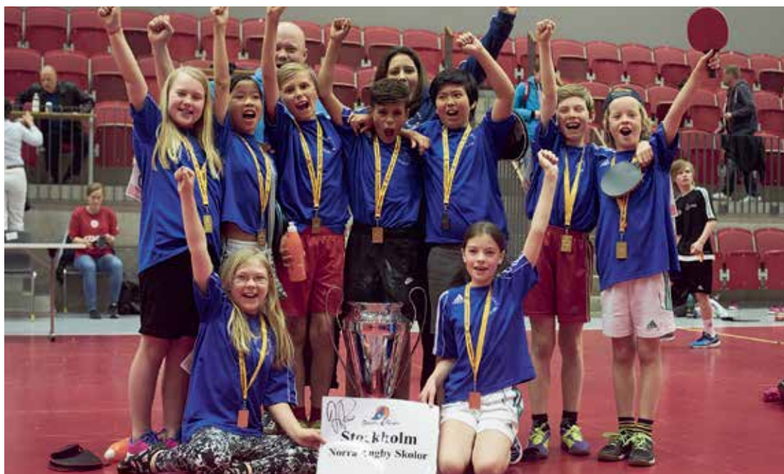
VIKTIG REKRYTERINGSBAS. Ungdomstävlingen Bästa Fyran avgjordes i Halmstad våren 2016.

sor av arbete men ger även en rad spin-off effekter i form av enormt medialt intresse men också potentiellt fler spelare och en allmänt växande bordtennisfamilj. Något som nu hela bordtennis-sverige behöver vara redo för, enligt Petra Sörling.