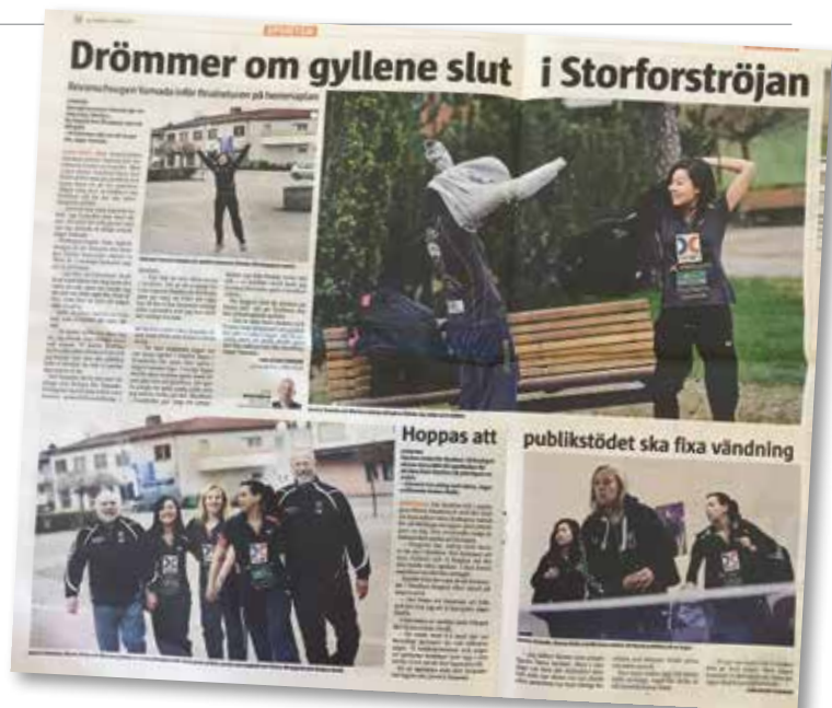
FINAL I STORFORS. SM-final är en stor händelse i Storfors och Storfors BTK får stor uppmärksamhet i pressen (Faksimil Värmlands Folkblad 170512).

I herrfinalen utgjordes de båda finallagen till fyra sjättedelar av utländska spelare. Svårt att ha synpunkter på detta så länge regelverket följs. Det man i så