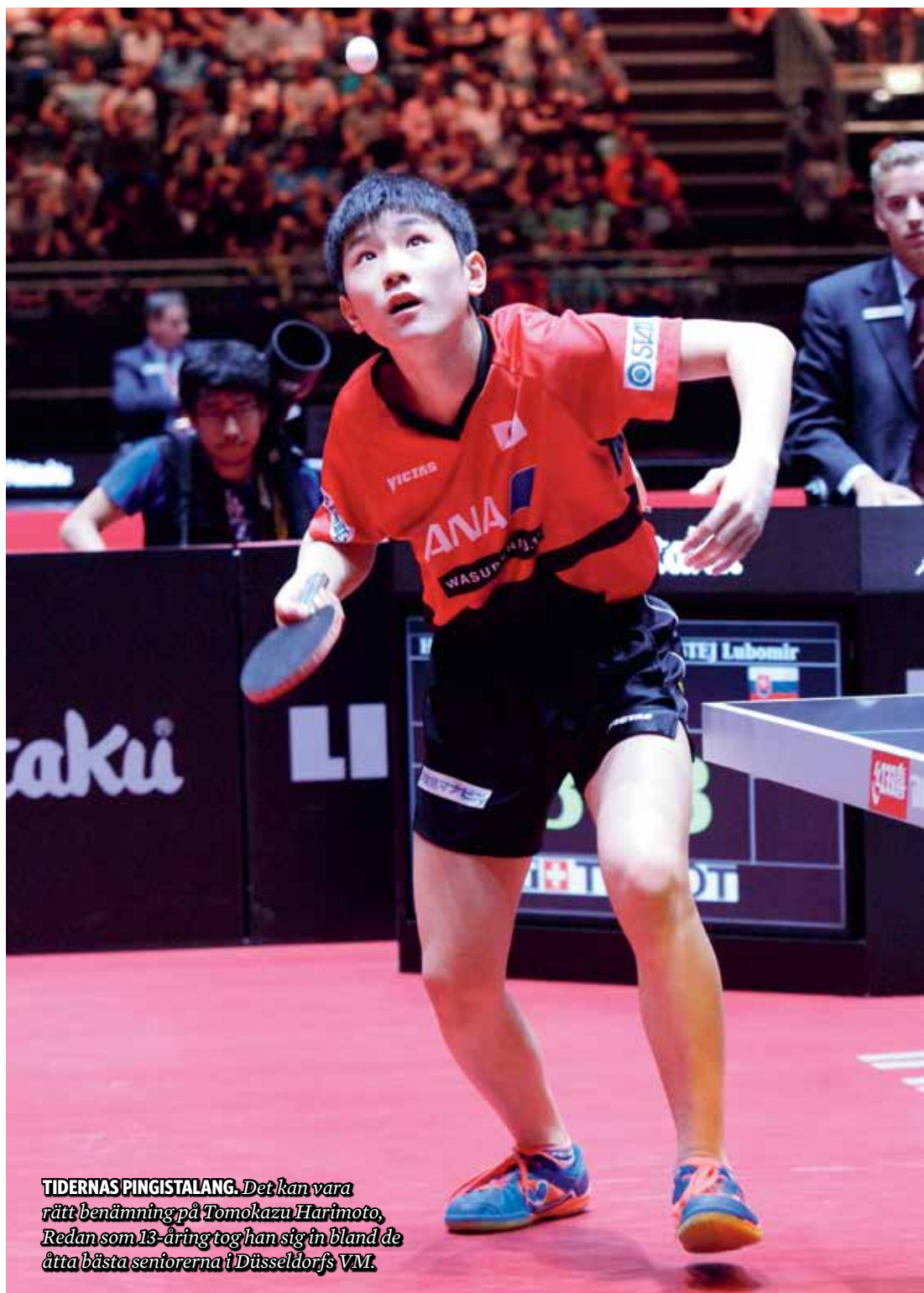
TIDERNAS PINGISTALANG. Det kan vara rätt benämning på Tomokazu Harimoto, Redan som 13-åring tog han sig in bland de åtta bästa seniorena i Düsseldorfs VM.