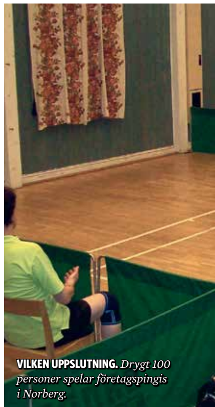
VILKEN UPPSLUTNING. Drygt 100 personer spelar företagspingis i Norberg.

Vad är då framgångsnyckeln? – Allting spelas i vår egen hall, och det tror jag är den viktigaste förutsättningen för att få ihop planeringen och en central samlingspunkt, konstaterar han och fortsätter: