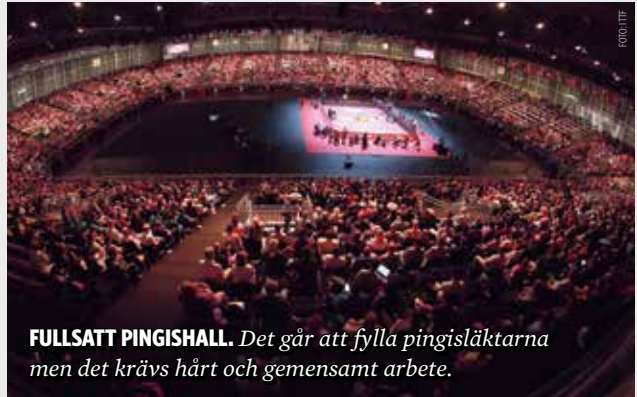
FULLSAT PINGISHALL. Det går att fylla pingisläktarna men det krävs hårt och gemensamt arbete.