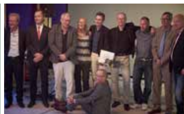
SPEXIGT VÄRRE. Tjo och tjim när Mästarklubben invigdes.