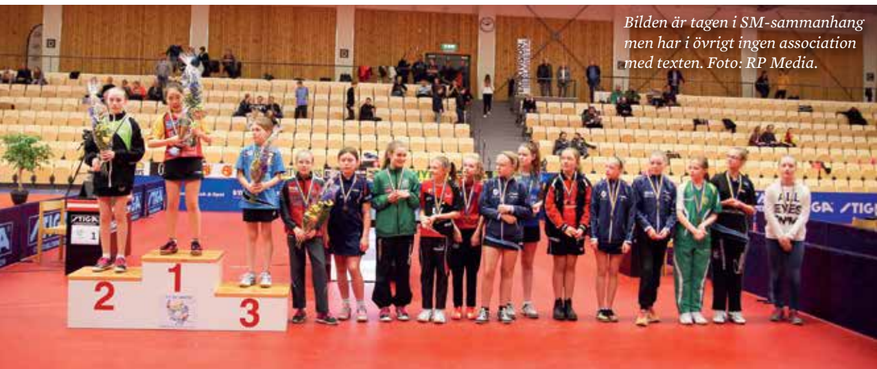
Bilden är tagen i SM-sammanhang men har i övrigt ingen association med texten.