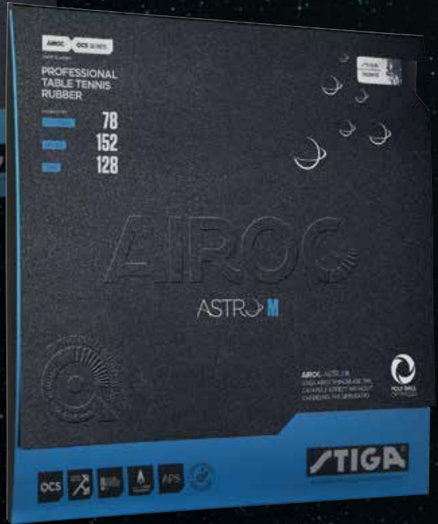
AIROC ASTRO M CONTROL 78 / SPEED 152 / SPIN 128 / STYLE: SPIN ELASTIC / SPONGE: MEDIUM