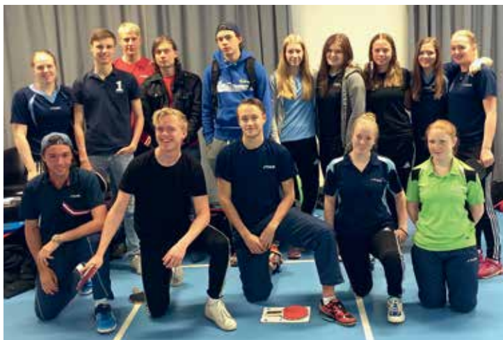
TRÄNARE ÄR VI ALLIHOPA. Eleverna på Asperogymnasiet i Halmstad som under våren 2015 genomgick Ungdom 1.

utbilda sig till tränare var Eslöv, som på eget initiativ startade projektet under hösten 2013. Sedan i våras har detta även anammats av Svenska Bordtennisförbundet vars målsättning nu är att samtliga elever skall genomgå en tränarutbildning.