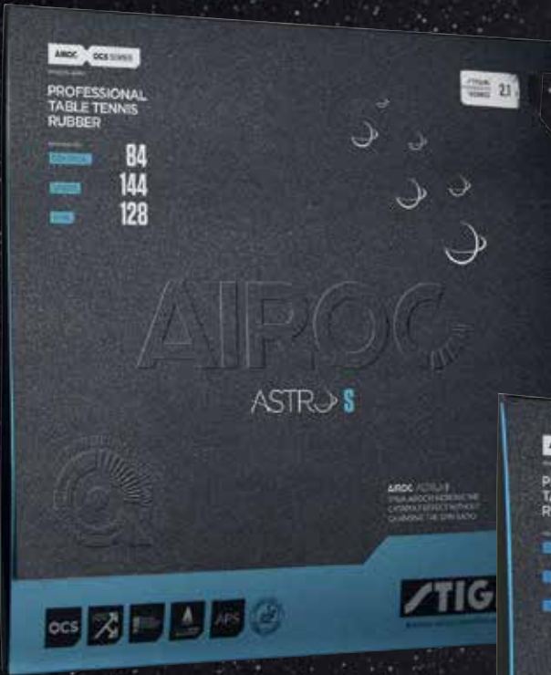
AIROC ASTRO S CONTROL 84 / SPEED 144 / SPIN 128 / STYLE: SPIN ELASTIC / SPONGE: SOFT