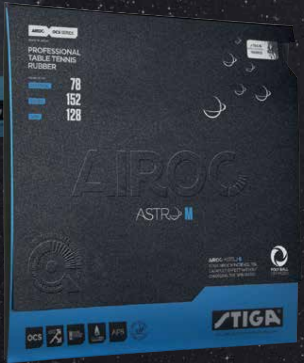
AIROC ASTRO M CONTROL 78 / SPEED 152 / SPIN 128 / STYLE: SPIN ELASTIC / SPONGE: MEDIUM