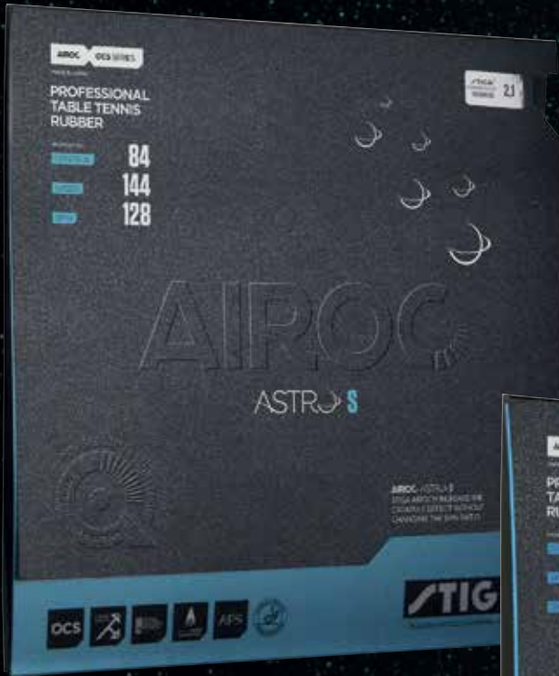
AIROC ASTRO S CONTROL 84 / SPEED 144 / SPIN 128 / STYLE: SPIN ELASTIC / SPONGE: SOFT