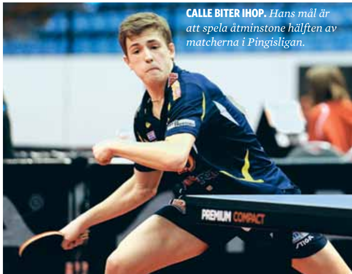
CALLE BITER IHOP. Hans mål är att spela åtminstone hälften av matcherna i Pingisligan.

Silverkadetten från UEM 2011 laddar batterierna och är redo för Pingisligan.