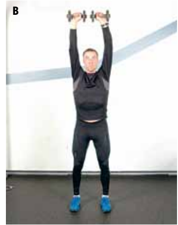
FIGUR A-B. Axelpress med hantlar

tigt att ha en genomtränad kropp. Dels för att rent fysiskt orka med träningen och hålla sig borta från onödiga skador. Dessutom bygger man upp ett självförtroende och en trygghet genom att veta att