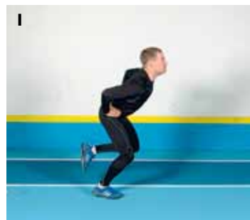
FIGUR G-I. Enbenshopp