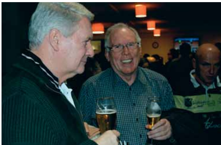
GLADA MINER I PAUSEN. Düsseldorfleder och två åskådare diskuterar matchen över en pils.