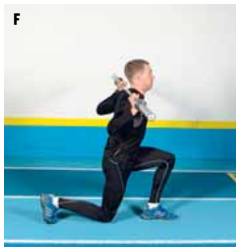
FIGUR C-F. Utfall framåt med skivstång.