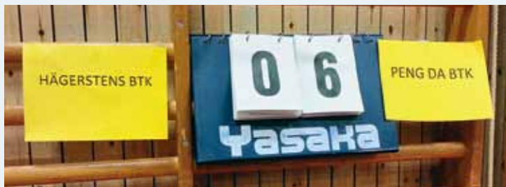
SNYGG TAVLA. 6-0 mot Hägersten - det kunde inte bli bättre för Peng Da BTK.

- För närvarande är träningsmöjligheterna dåliga, vi håller till på tre ställen olika dagar i veckan. I en gymasal spelar vi på tre bord, på en annan skola har vi tillgång till fyra bord och