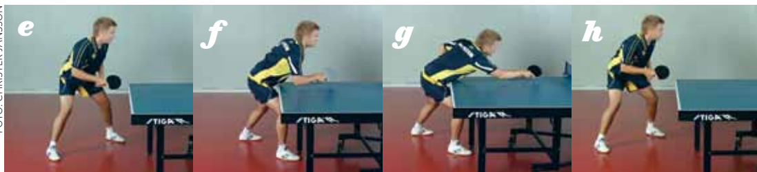
GRUNDEN TILL ALLT. Bildserien ovan visar grunduppställningen i startläge, "one step-in" för retur på kort boll, sen snabbt tillbaka till ut grunduppställning.