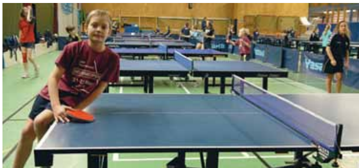
HUGO TIDIGT UTE. Han heter Sacilotto i efternamn och vann Folksamcupen mot äldre konkurrenter redan då han var åtta.

Den Boo-kö som fanns i juletid har tömts. Nu har det bildats en ny kö av pingissugna ungdomar.