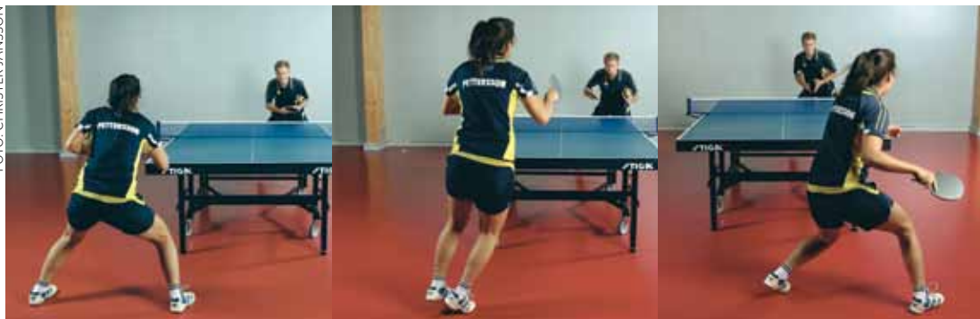
SIDLEDSFÖRFLYTTNING, "SIDE TO SIDE". Sidledsförflyttningen används vid förflyttningar både åt höger och vänster. Förflyttning är den vanligaste och mest grundläggande för en bordtennisspelare. Vid förflyttning åt ett håll skjuter spelaren ifrån med ben och fot på motsatt sida. Slaget sker när förflyttningen är gjord.