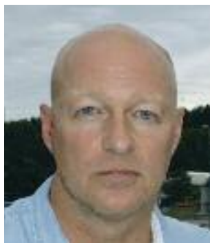
ANDERS vill se svenska klubbar i Champions League.