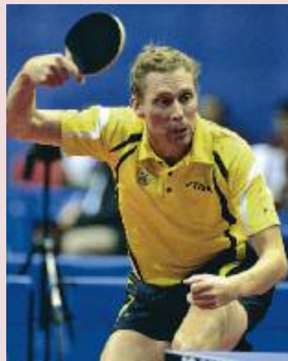
MED BLAND DE 16 SISTA i EM för tionde gången på tolv mästerskap.