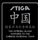
XU XIN Blade: Rosewood NCT V Rubber: Calibra LT