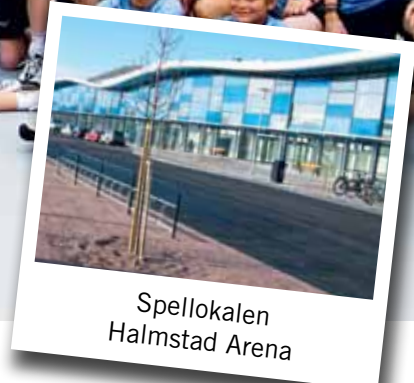
Spellokalen Halmstad Arena