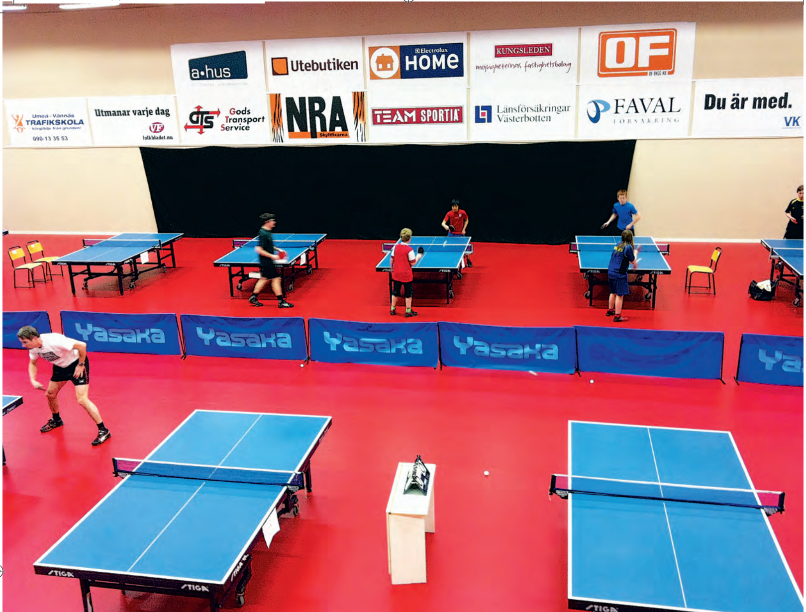
I EGEN PINGISHALL. Nybildade Umeå BTK har fått en fin tillvaro i det nya pingiscentret i stadsdelen Ersboda. Borden står upp de dygnets alla timmar. De ska ge pingisen ett uppsving.