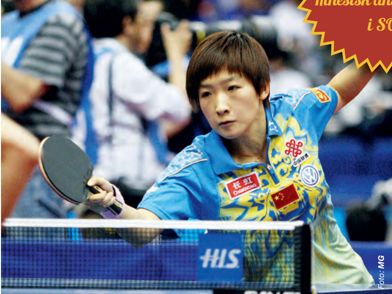
LIU SHIWEN, sexa i världen.