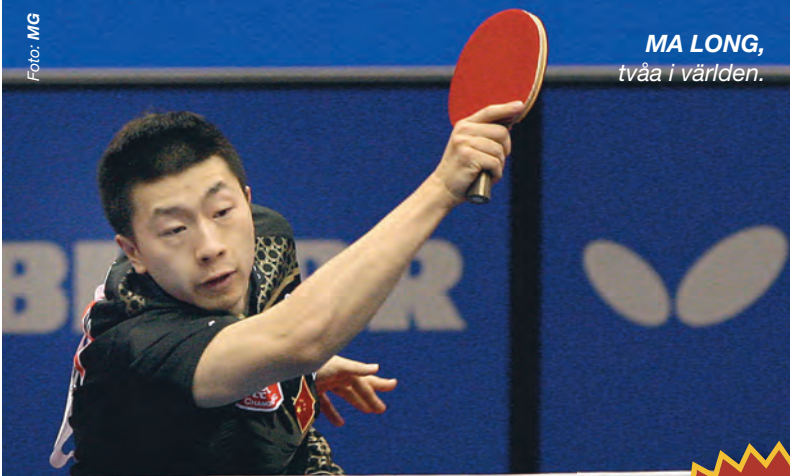
MA LONG, tvåa i världen.