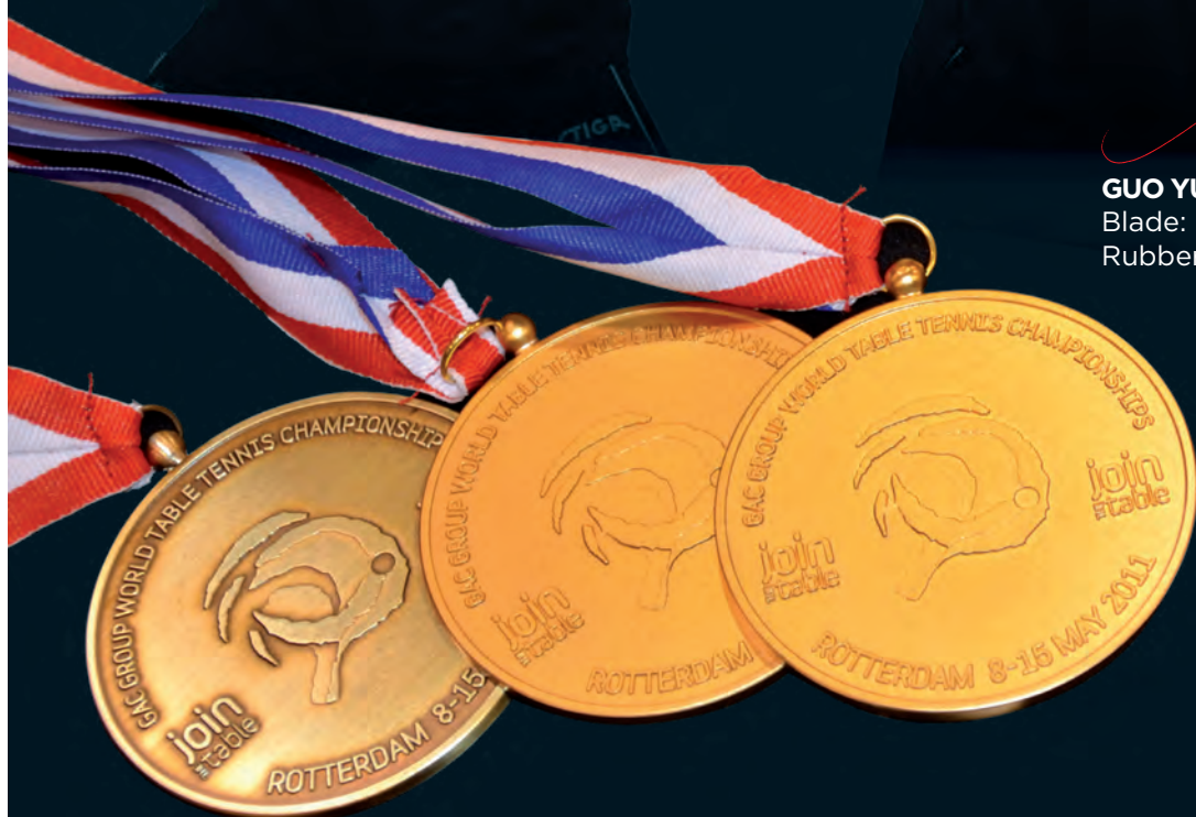
GUO YUE Blade: Ebenholz NCT V Rubber: Calibra LT