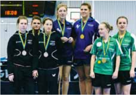
GULDGRATTIS! Damjuniorer 17-segrarna i Ljungsbro BTK omgivna av tvåorna i IK Juno och treorna i Lekstorps iF.