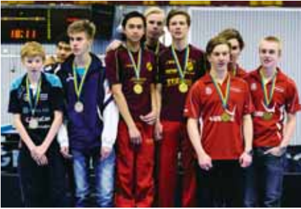
GULDGRATTIS! Herrjuniorer 17-segrarna i Ängby SK omgivna av tvåorna i Spårvägens BTK och treorna i BTK Safir.