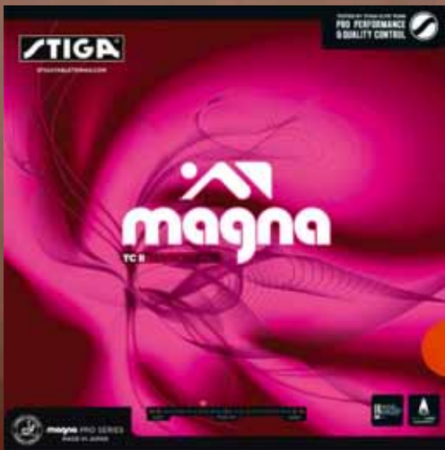
MAGNA TC II