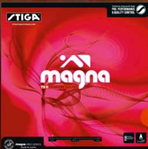
MAGNA TS II

Magna TS II is the outstanding choice for offensive players of almost all playing levels who like soft sponges with an amazing sound when striking the ball. Magna TS II gives you excellent control of all your strokes, thanks to the unique Magna surface, while the specially developed TS II sponge gives you the speed you are searching for when attacking the ball. Magna TS II is made in Japan