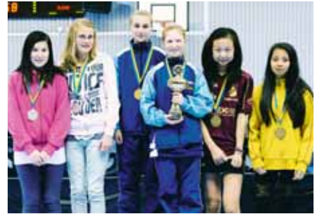
GULDGRATTIS! Flickor 13-segrarna i Falkenbergs BTK omgivna av tvåorna i Uddevalla BTK och treorna i Ängby SK 1.