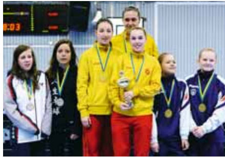
GULDGRATTIS! Flickor 15-segrarna i Ängby SK omgivna av tvåorna i Åsa IF och treorna i Spårvägens BTK.