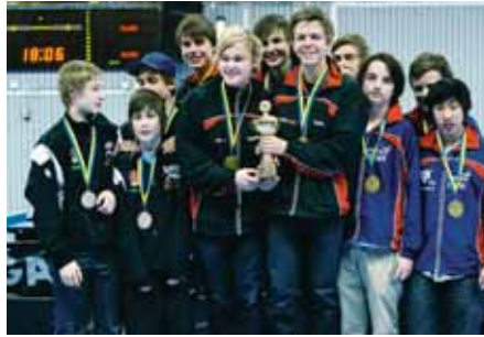
GULDGRATTIS! Pojkar 15-segrarna i BTK Frej omgivna av tvåorna i BTK Linné och treorna i KFUM Kristianstad.