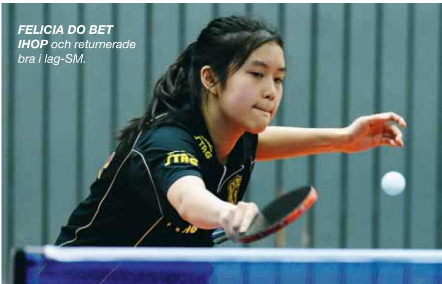
FELICIA DO BET IHOP och returnerade bra i lag-SM.