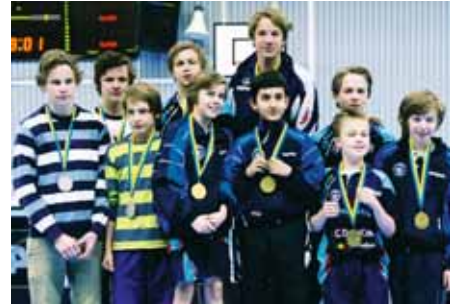
GULDGRATTIS! Pojkar 13-segrarna i Spårvägens BTK omgivna av tvåorna i Borlänge BTK och treorna i Spårvägens BTK.