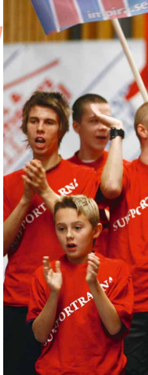
TRYCKET ÖKAR i Söderhamn i takt med att