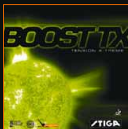
BOOST TX RED/BLACK