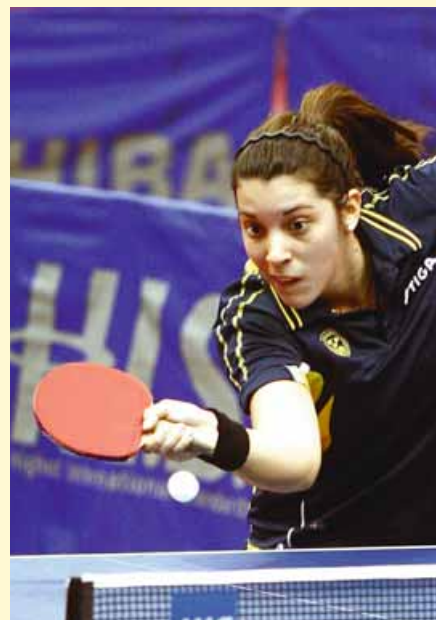
MALIN har en jämn statistik för seten där det skiljer bara två bollar.

Intressant är att de svenska tjejerna, som inte tävlar utomlands lika ofta som grabbarna, har ett plus och slår det andra könet i två års set med tvåbollarsmarginal: 108–104 mot 258–292.