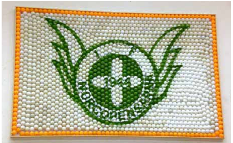
1 500 BOLLAR gav det här fina resultatet i Norcohallen.

Planerna var att visa tavlan vid klubbens C-tävling "Norco-Frid-